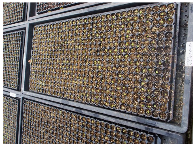
温室の中で発芽、順調です